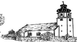
St. Maria Verkündigung Günching