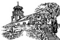
St. Martin Lengenfeld