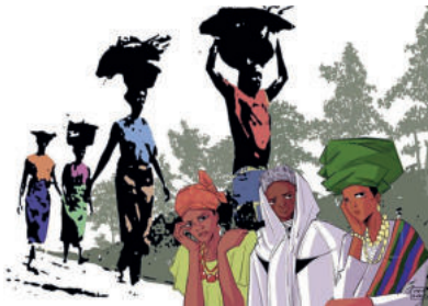
© Titelbild der GDO aus Nigeria

„Kommt! Bringt eure Last“. Gastgebendes Land: Nigeria