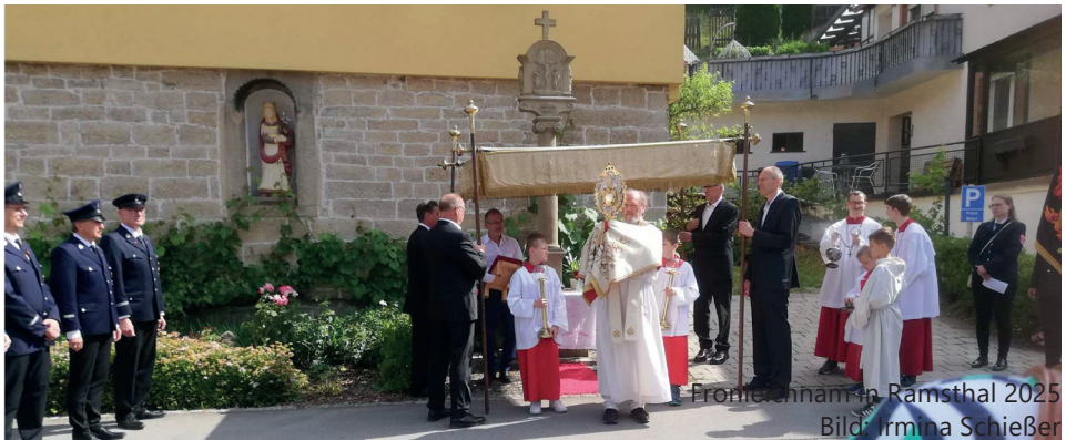
Fronleichnam in Ramsthal 2025

In Bad Kissingen gibt es wieder den „Blumenteppech“ aus einzelnen Kartons. Dazu kann man vorher in der Herz Jesu Kirche oder im Pfarrbüro einen Karton holen, ihn beliebig ausschmücken und dann am Feiertag mitbringen und zu den anderen Kartons dazu legen.