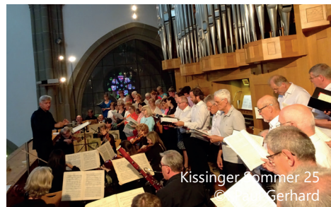
Kissinger Sommer 25