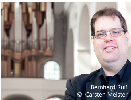
Bernhard Ruß ©: Carsten Meister