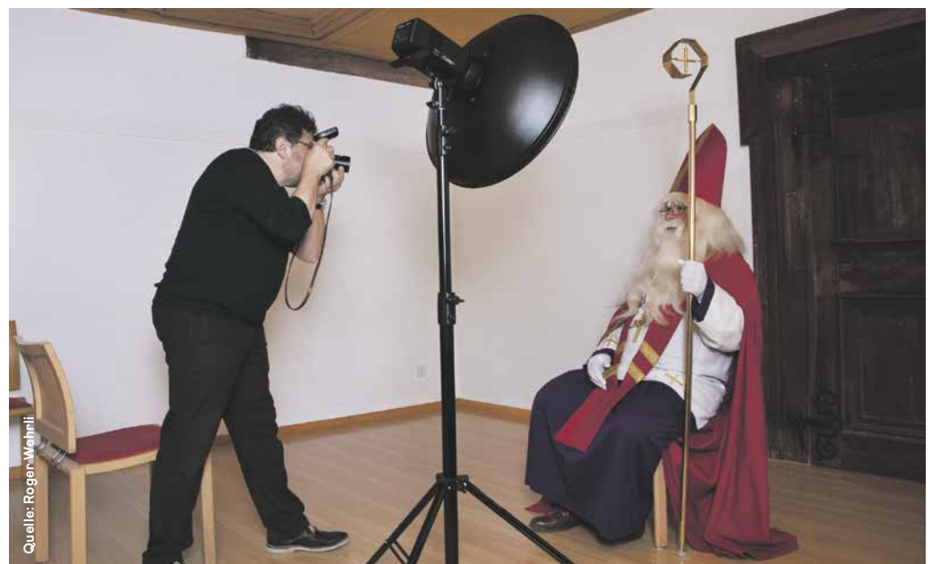
Zahlreicher hoher Besuch: An der Samichlaussynode findet nicht nur einer, sondern fast hundert Chläuse und Schmutzli den Weg in die Propstei.