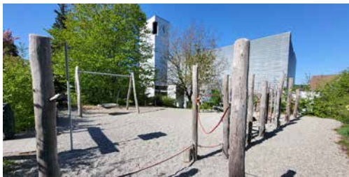
Der Spielplatz «St. Martins Arche» der Pfarrei Entfelden ist ein gelungenes Beispiel eines gestalteten Sozialraums.