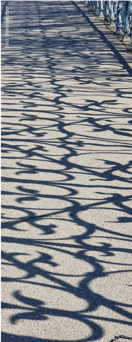
Luisensteg über die Dreisam