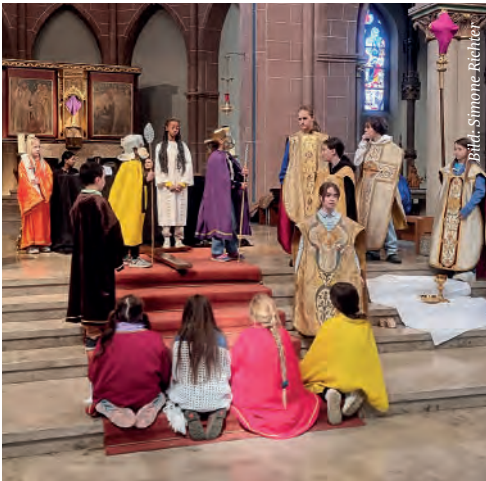
Viele Kinder und Jugendliche gestalteten schon 2025 das Passionsspiel in der Kirche Herz Jesu.

Karfreitag, 3. April, 10.30 Uhr Mit Kindern und Jugendlichen den Kreuzweg ganz nah erleben. Kirche Herz Jesu, Stühlinger Kirchplatz