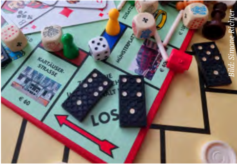
Spielerisch in Gesellschaft sein in Lehen