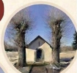
Krümmel Sa 03.10.2026 • 18.00 Uhr