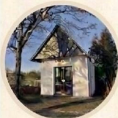
Maroth Do 18.06.2026 • 18.00 Uhr