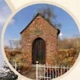
Sessenhausen So 28.06.2026, 17 Uhr