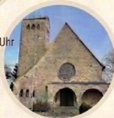
Kuhnhöfen Di 08.09.2026 • 18.00 Uhr