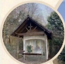
Marienrachdorf Mi 01.04.2026 • 15.00 Uhr