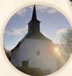
Oberherschbach So 29.11.2026 • 14.00 Uhr

Treffpunkt: Kapelle in Karnhöfen / Karnhöfener Straße