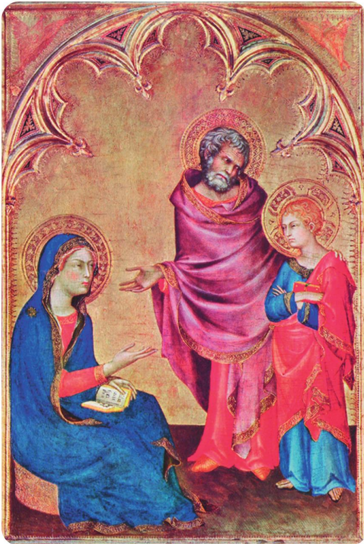
Simone Martini, Der zwölfjährige Jesus im Tempel , 1342

kehren alle wieder zurück, Jesus bleibt aber im Tempel. Das fällt den Eltern nicht sofort auf; Zeichen dafür, dass Jesus fast schon erwachsen war. Als sie sein Fehlen bemerken, suchen sie ihren Sohn voller Angst. Als sie ihn im Tempel finden, machen sie Jesus Vorwürfe, auf die er verständnislos reagiert. Diese Szene hat über 1.300 Jahre später der Maler Simone Martini festgehalten, und ein auffallend modernes Bild gemalt: Jesus trotzt. Oder er ist bockig. Besteht auf seinem eigenen Willen. Trotz herum, würden manche vielleicht sagen – kurzum: er reagiert wie ein ganz normaler Jugendlicher, der in diesem Moment wenig Verständnis für seine Eltern hat; und andersherum wird das ähnlich gewesen sein. Ich finde das herrlich natürlich und menschlich.