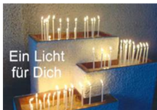
Opferkerzen in Maria Königin Baldham