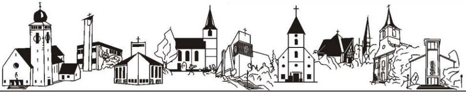
St. Laurentius Bretten