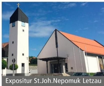
Expositur St.Joh.Nepomuk Letzau