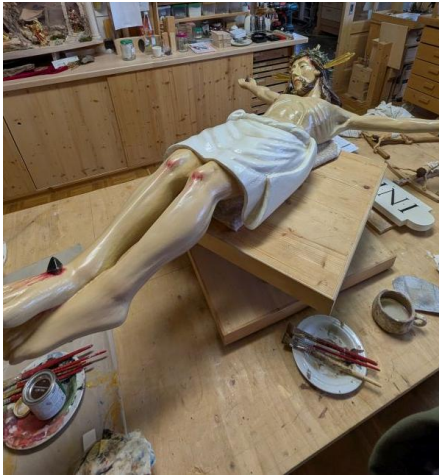
Die Figuren in der Holzschnitzerei Schinner