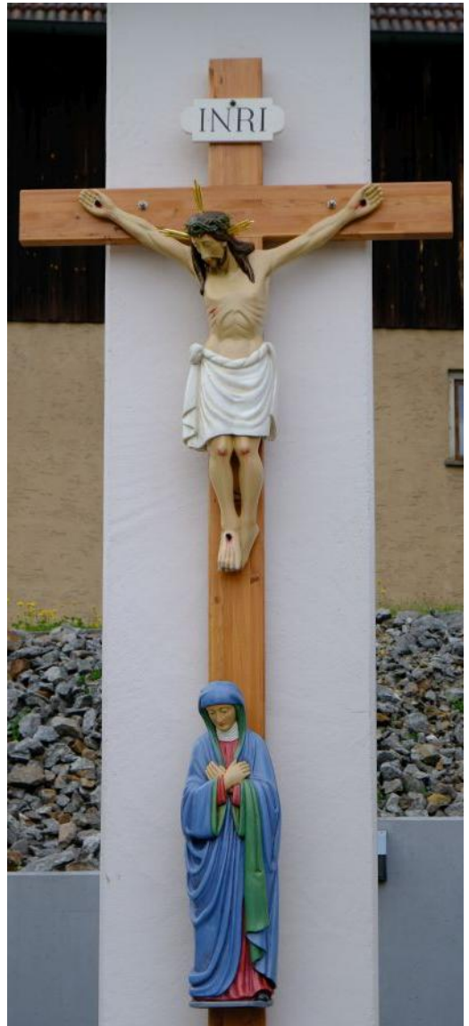
Das frisch restaurierte Missionskreuz auf dem Kirchenvorplatz in Letzau