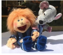
Die Kirchenmaus und Karli freuen sich auf Euch!

Wortgottesfeier mit KinderFamilienKirche