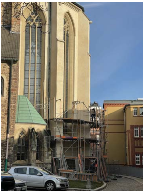
Am Hochchor fallen die Gerüste...

Auch in der Nachbarschaft ging es weiter voran. So fielen jetzt die Gerüste an der Nordseite und am Hochchor der Wallonerkirche sowie am langgestreckten Nachbargebäude.