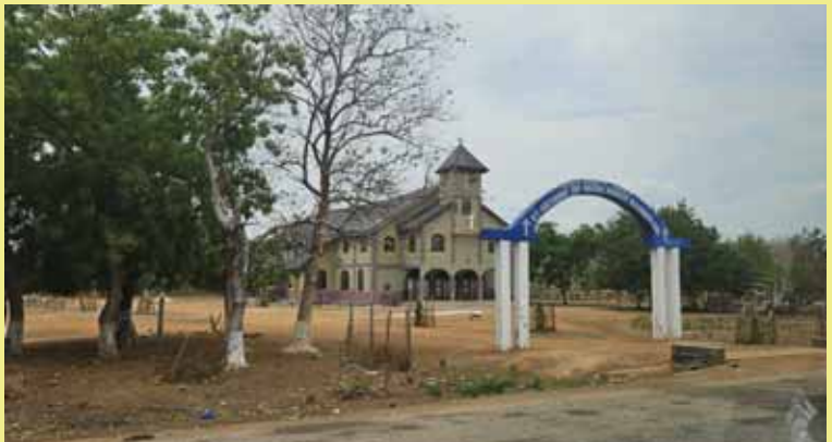
Einfahrt zur Missionsstation in Bamboi mit Blick auf die neue Kirche