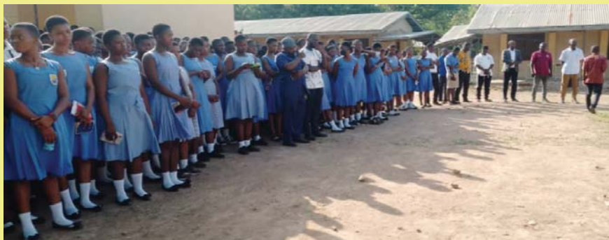
Die ganze Schulgemeinschaft im Bild

IBAN: DE39 8105 3272 0032 2107 00 BIC: NOLADE21MDG