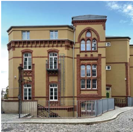
Ehemalige preußische Arbeitsanstalt - Nordteil...