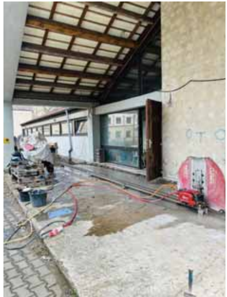
Schneidemaschine für Trennung der Bodenplatte im Eingangsbereich

gilt für die Außenanlagen. Damit sind die großen Vorhaben nach Norden hin fast abgeschlossen; es fehlen noch einige historische Straßenlaternen und natürlich die Südfassade der Wallonerkirche, an der es nach Auskunft unserer evangelischen Nachbarn noch in diesem Jahr weitergeht.