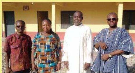
Das aktuelle Leitungsteam der Schule

Einfach erfreulich ist, dass die Schule weiter wächst. Man kann den Eindruck gewinnen, dass die- ses Projekt genau richtig angelegt und die Schule zukunftssträftig ist.