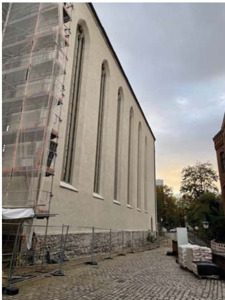
Neu verputzte Nordfassade der Wallonerkirche

Vom Klosterbau gibt es zu vermuten, dass ein kleines Stück des Zugangs zum historischen Teil innerhalb des Klostergebäudes fertiggestellt werden konnte, wo noch Estrich und Bodenbelag fehlten. Zumindest liegen nun dort Fliesen im Verbund mit einer größeren Sauberlaufzone. In den nächsten Wochen geht es hier mit noch fehlenden kleineren Ergänzungen an Geländern, Laufflächen und Absturzsicherungen zum Lutherturm weiter.