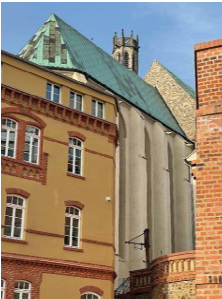
Impressionen der sanierten Gebäude der Nachbarn vom Schleinufer aus

So wurde die Fassade der Wallonerkirche bereits auf drei Seiten saniert und damit mit einem originalgetreuen Putz wie in der Erbauungszeit versehen. Sie erstrahlt jetzt in frischem Glanz.