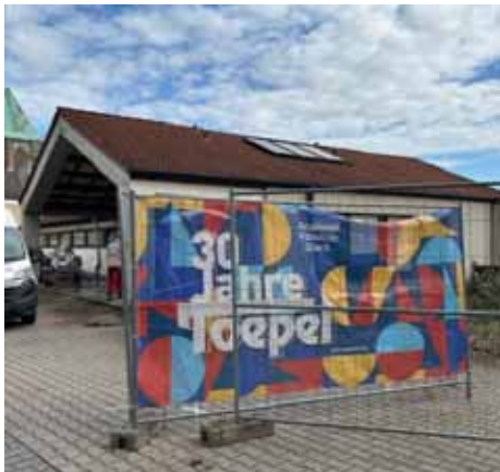
Bauzaun vor dem Alten Gemeindehaus