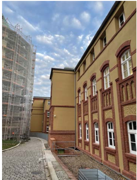
... und Südteil neben dem Kloster zum Hof hin

Förderverein Prämonstratenser- kloster Magdeburg e.V.