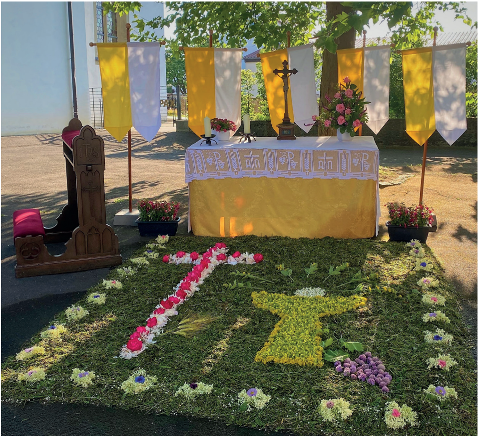
Fronleichnam: Altar in Ballingshausen

Am 25. Juni bleibt das Pfarrbüro in Hesselbach geschlossen. Vielen Dank für Ihr Verständnis!