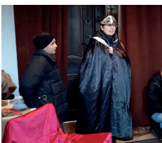
Station 3: Rollenspiel

Mit einem Rollenspiel wurde den Kindern die Verurteilung nahegebracht. Dabei durften die Kinder lautstark das Volk vertreten, welches dafür war, das Jesus verurteilt wurde.