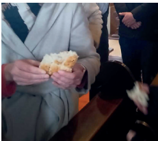
Brot wird geteilt

Besonders bewegt waren die Kinder beim Teilen des Brotes und des Traubensaftes. Jedes Kind durfte ein Stück nehmen und an den Nachbarn weitergeben. Dabei wurde schnell klar: Teilen macht Freude und verbindet.