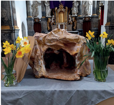
Station 5: leeres Grab

Die letzte Station endete am Altar. Nachdem der große Stein vom Grab weg gerollt wurde, riefen die Kinder begeistert „das Grab ist leer“.