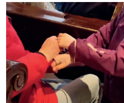
Station 2: gefesselt

An dieser Station fesselten sich die Kinder gegenseitig versetzen sich in die Situation im Garten Gethsemane.