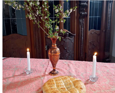
Station 1: letztes Abendmahl

Mit kleinen Schritten, offenen Herzen und vielen neugierigen Augen machten sich die Kinder der Kinderkirche Grettstadt auf den Weg durch den Kinderkreuzweg. An den einzelnen Stationen durch die Kirche wurde nicht nur erzählt und zugehört, sondern auch gelacht, gefühlt, geteilt und mitgemacht. So wurde die Geschichte von Jesus für die Kinder lebendig wie ein Weg voller Fußspuren im Sand.