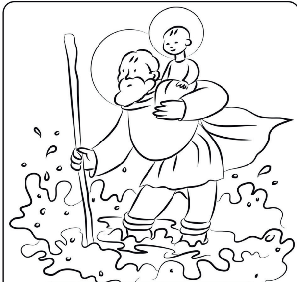
Grafik: Anna Zeis-Ziegler aus pfarrbriefservice.de

Bis heute ranken sich viele verschiedene Legenden um ihn. Als gesichert gilt lediglich die Weihe einer Kirche. Einer Märtyrerkirche, die nach ihm benannt ist. Im Jahr 454. In Chalkedon, dem heutigen Stadtteil Kadiköy in Istanbul.