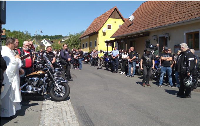
Motorr adsegnung Bierbaum