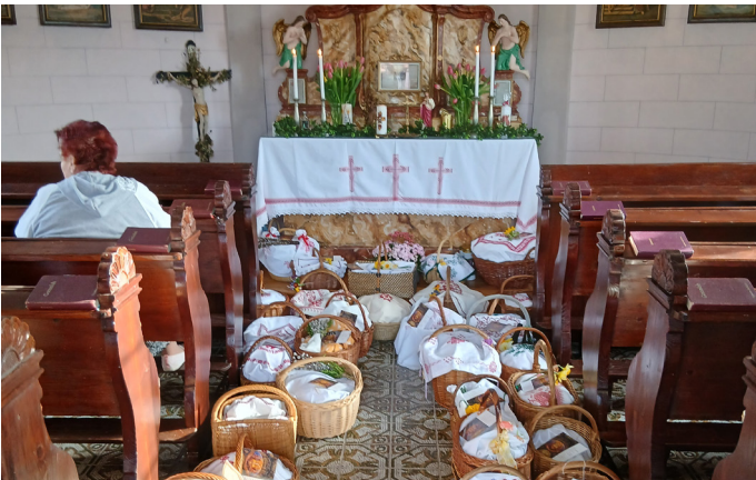
Kirchbach - Ostersp eisensegnung Kapelle Dörfla