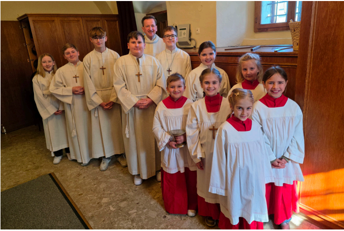
St. Stefan/R. - Ostersonntag