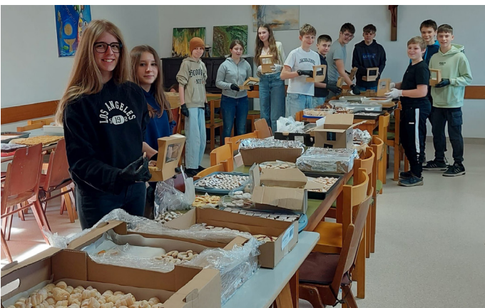
Firmpfarrcafe Bad Gleichenberg