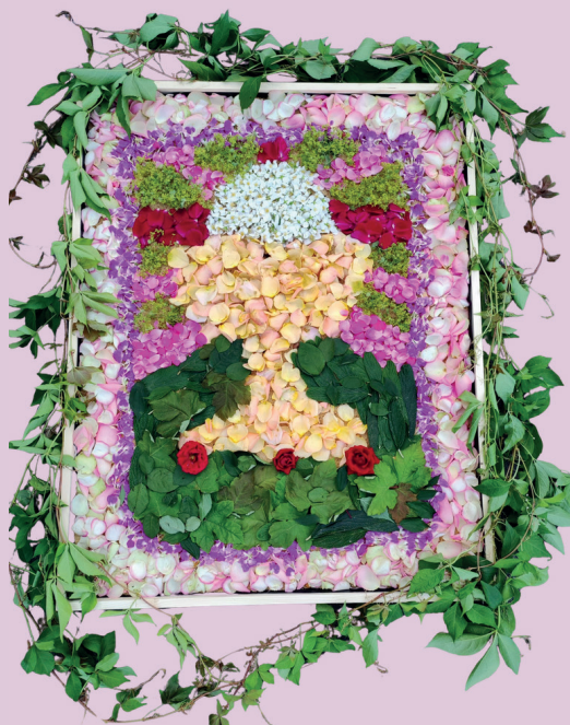
BLUMENTEPPICH DES LETZTEN FRONLEICHNAM-FESTES IN ETZENRICH

HERR, GESTÄRKT DURCH DEIN WORT UND DEIN BROT DES LEBENS SENDEST DU UNS HINAUS. MICHAEL LEHMLER