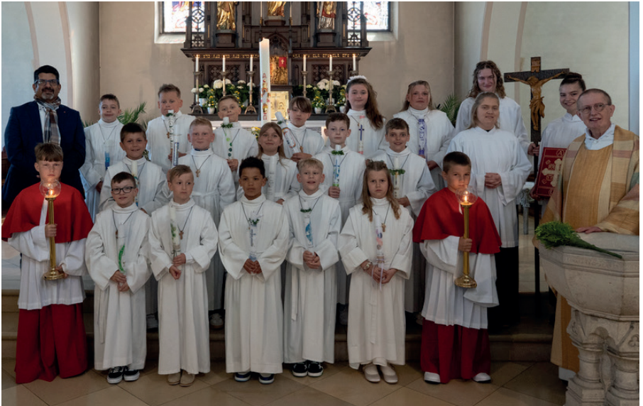
in Rothenstadt am 10. Mai