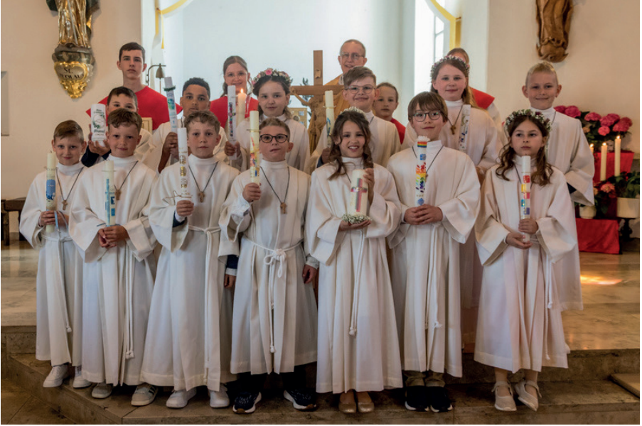
in Etzenricht am 3. Mai