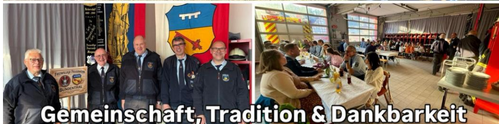
Gemeinschaft, Tradition & Dankbarkeit

Am Samstag, dem 9. Mai 2026 feierten wir in der Kirche St. Peter und Paul dies diesjährige Floriansmesse zu Ehren des Schutzpatrons der Feuerwehr.