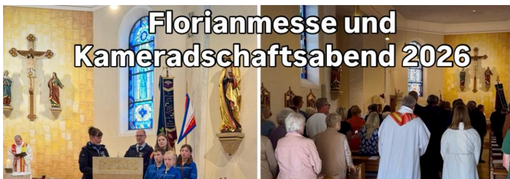
Florianmesse und Kameradschaftsabend 2026