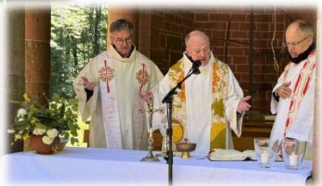
Bilder: Christoph Köhler