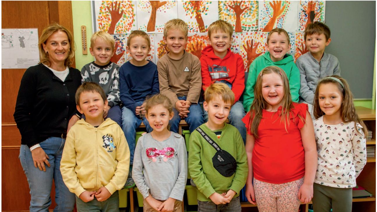
OBERMÜHLBACH 1. KLASSE

Der Pfarrverband Frauenstein begrüßt alle neuen Volksschülerinnen und Volksschüler in Kraig und Obermühlbach und wünscht euch einen guten Schulerfolg mit Gottes Segen!