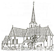
St. Walburga Kirchrötenbach