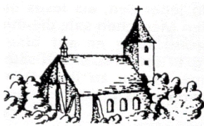
Mariä Heimsuchung Bühl