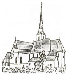
St. Walburga Kirchrötenbach