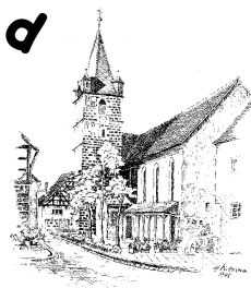
St. Kunigund Schnaittach