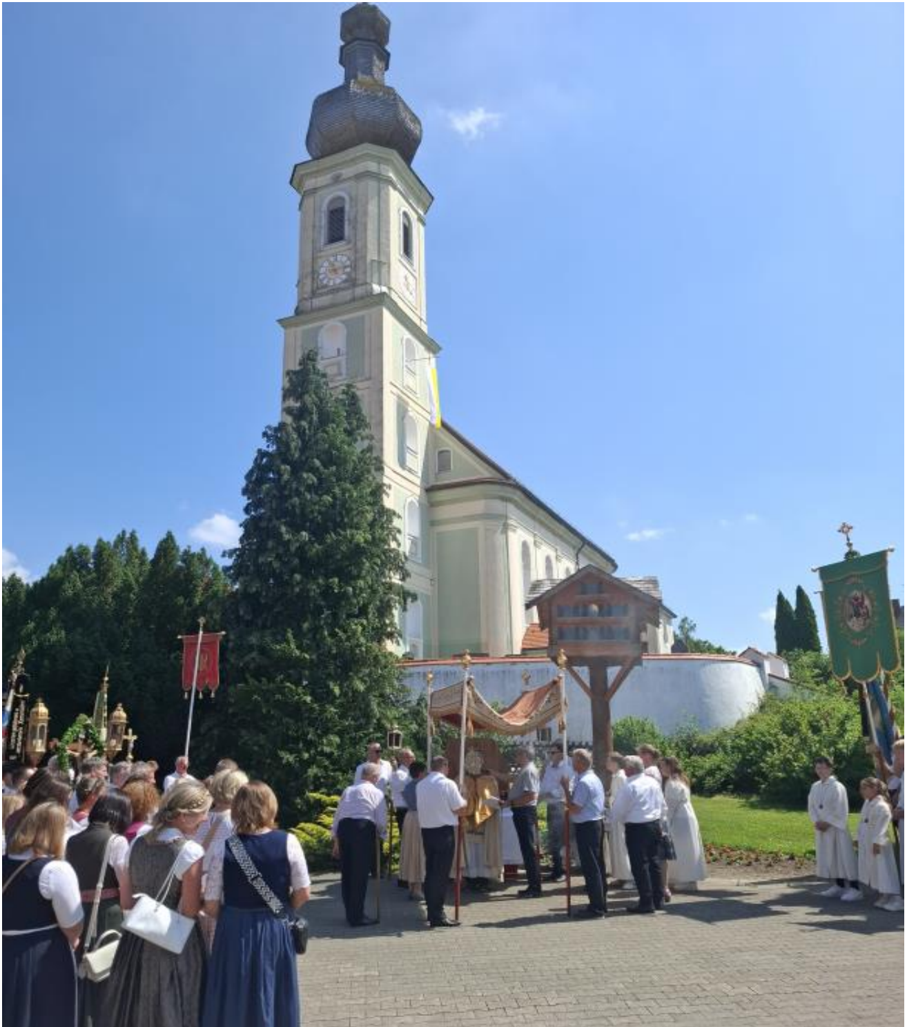
Bild: Fronleichnam-Prozession 2025 in Niederding im Rahmen des 1275-Deanger-Jubiläums

Hofmarkstraße 8, 85462 Eitting (0 81 22) 99 98 38 - 0 0171 55 97 26 6 pv-erdinger-moos.de pv-erdinger-moos@ebmuc.de Dienstag, Mittwoch und Freitag 08.30 - 12.00 Uhr Dienstag zusätzlich 13.00 - 17.00 Uhr Montag, Donnerstag geschlossen