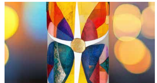
Die Heimosterkerze kostet Fr. 10.00.

Aus der Verwandlung der Raupe entsteht der Schmetterling – ein Sinnbild für Auferstehung, Hoffnung und Neubeginn. In seinen leuchtenden Farben trägt er die Botschaft von Ostern: Das Leben bricht auf, das Dunkel wandelt sich in Licht, und die Liebe Gottes schenkt uns immer wieder neue Flügel.