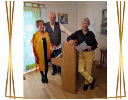
Flyer liegen im Schriftenstand in unseren Kirchen auf.