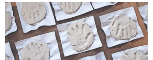
Handabdrücke, passend zum Thema.

Am Samstag, 7. März werden sich unsere 23 Erstkommunionkinder mit ihren Eltern auf ihren grossen Tag unter dem Motto «In Gottes Hand geborgen» vorbereiten.