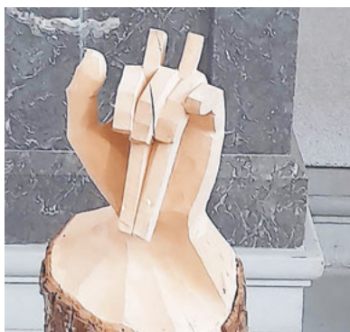
Bildhauer und Bild: Nikolaus Blättler

Chlefelen ist besonders im inneren Kantonsteil von Schwyz verbreitet. «Chlefeli» sind kleine Holzplättchen, die zwischen den Fingern geschwungen und rhythmisch zusammengeschnitten werden. Vom Aschermittwoch bis Karsamstag, also während der ganzen Fastenzeit, erklingen sie auf Schulwegen und Dorfplätzen. Kinder und Jugendliche spielen traditionelle