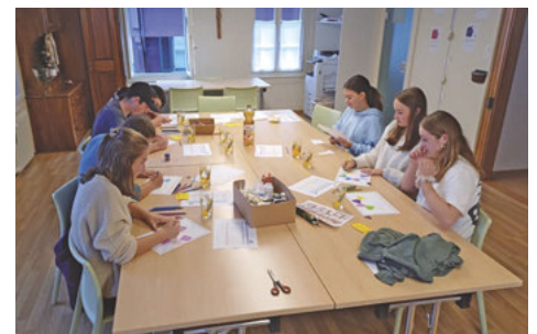
Vorbereitungsabend auf die Firmung