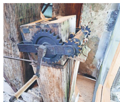
Raffelen in der Pfarrkirche

Raffelen oder Ratschen hingegen ist liturgisch gebunden. Von Gründonnerstag bis Karsamstag schweigen die Kirchenglocken. In dieser Zeit erklingen die Kirchenglocken. Von Kirchtürmen hölzerne Raffelen durchs Dorf und ersetzen das Glockengeläut. Sie rufen zu Gebet und Gottesdienst und erinnern an Leiden und Tod Jesu. Das Raffelen ist zeitlich klar begrenzt und symbolisiert Trauer und Ernst der Karwoche.