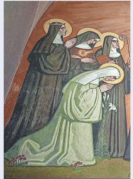
Hl. Franziska von Rom

Franziska verbindet viele Berufungen, die uns vielleicht gegensätzlich vorkommen: Aktives und kontemplatives Leben.