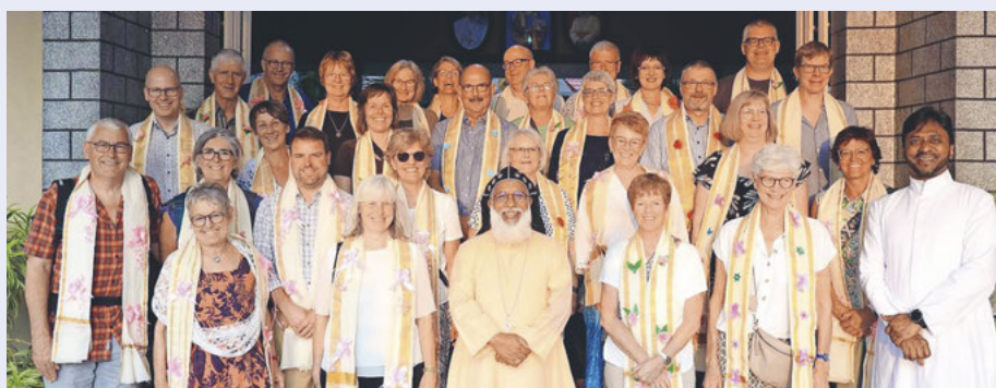
Die Indien-Reisegruppe beim Besuch bei Kardinal Baselios Cleemis.

Folgende Möglichkeiten zum Besuch einer unserer Versöhnungsfeiern in der Pfarrkir-