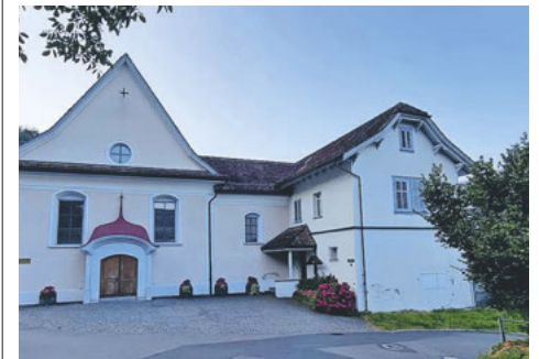
Klösterli St. Josef