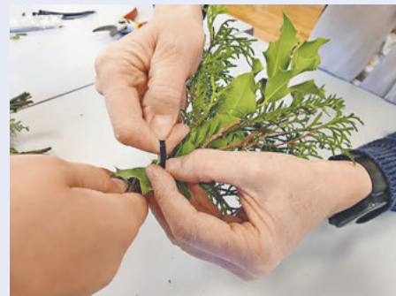
Palmstrüsschen als Gemeinschaftswerk.

Am Samstag, 21. März um 16.30 Uhr werden in einem Aufnahmegottesdienst die jüngsten Mitglieder offiziell aufgenommen. Anschliessend laden die Scharen zum Znacht und zum unterhaltsamen Eltern-