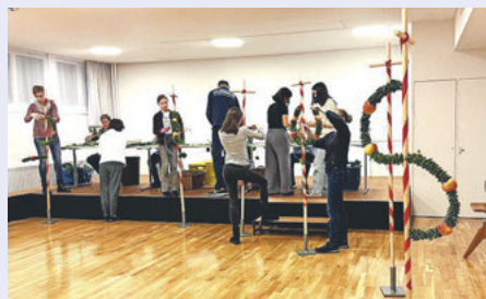
Ministranten und Helferinnen beim Palmstecken.

Unsere Palmstrüsschen bestehen aus Zweigen, die bei uns wachsen. Diese werden von den Sakristanen geschnitten und vorbereitet. Zur Herstellung der Palmstrüsschen werden Blätter der Stechpalme