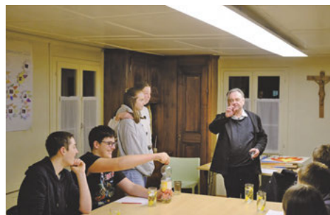
Besuch des Generalvikars bei den Firmlingen

Auch die Firmpatinnen und Firmpaten waren zu einem besonderen Abend eingeladen. In einer Postenarbeit in der Pfarrkirche und einem abschliessenden Wettbewerb konnten sie ihr Wissen testen. Natürlich kam bei all diesen Anlässen auch das gemütliche Zusammensein nicht zu kurz.