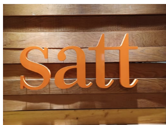
Restaurant Reykjavik/Island