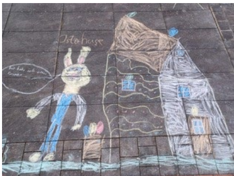
Künstler leider unbekannt Ort: Kirchplatz in Röthenbach

Nachmachen gewünscht! Bitte nur mit Straßenmalkreiden „arbeiten“!