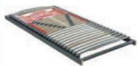
SYMPATHICA VISION N LATTENROST