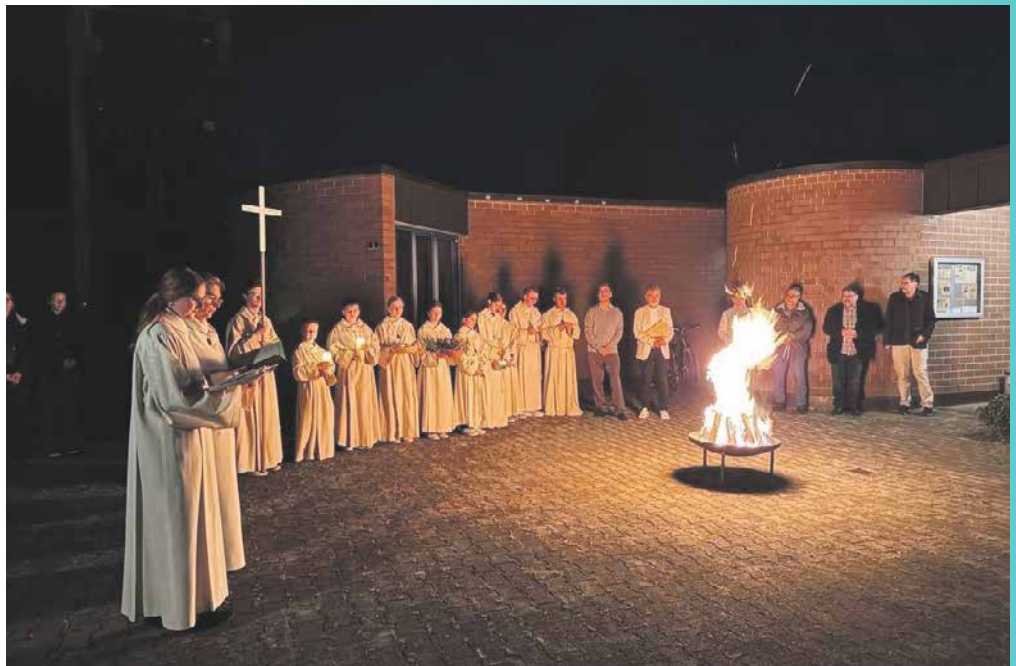
In vielen Pfarreien haben Osterfeuer lange Tradition. So auch im Kirchenzentrum Brugg-Nord in Riniken, wo die Osternachtsfeier um 21.30 Uhr am Feuer beginnt.

Das Feuer wird gesegnet, dann wird an ihm die Osterkerze entzündet. In einer feierlichen