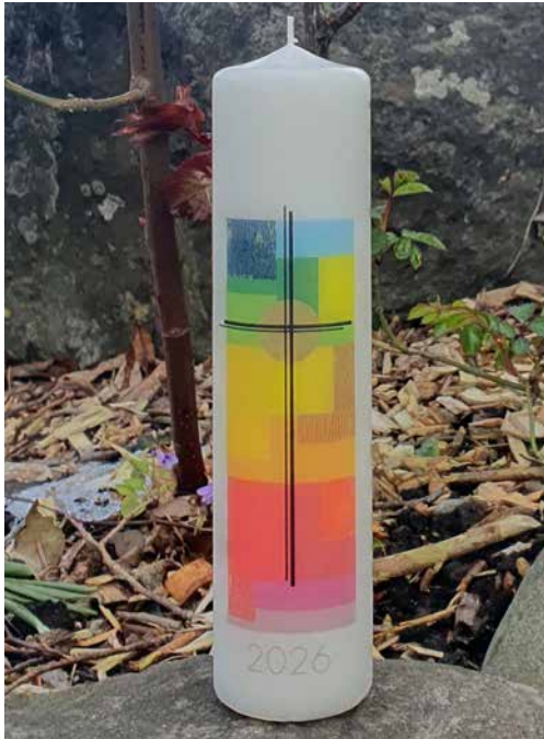
Unsere Osterkerze, die uns im Jahr 2026 begleiten wird

Die Osterkerze ist ein zentrales Symbol der Auferstehung Jesu Christi und steht für das Licht, das die Dunkelheit überwindet. Sie wird in der Osternacht feierlich entzündet und erinnert daran, dass Christus das Licht der Welt ist. Ihr Leuchten begleitet die Gläubigen durch die Osterzeit und darüber hinaus bei Taufen und Begräbnissen. Die Kerze verweist so auf Hoffnung, neues Leben und die Gegenwart Gottes unter den Menschen.