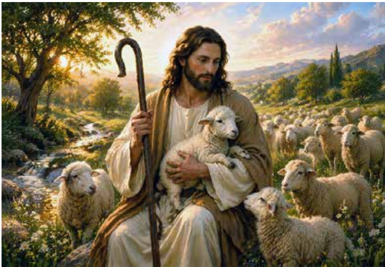
Bild: Jesus, der gute Hirte