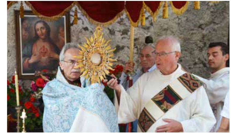
Im Bild: Herz-Jesu-Feier 2025

Durante i mesi estivi luglio e agosto l'ufficio parrocchiale rimane chiuso il venerdì. La riapertura sarà il 4 settembre.