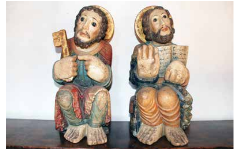
Im Bild die Apostel Petrus und Paulus

Die Mitglieder der Apostolatsgemeinschaft der Hl. Elisabeth treffen sich am Freitag, 26. Juni um 14:30 Uhr in der Widumkapelle zu einer Andacht. Darauf gemütliche Runde in der Pfarrstube.