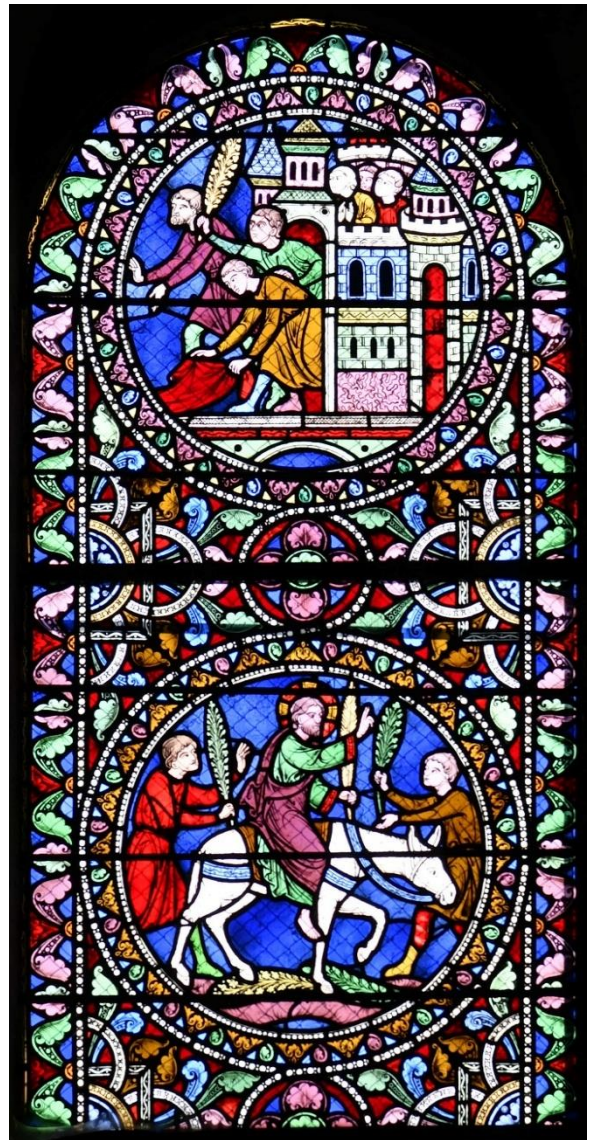
Fenster aus der Kathedrale in Le Mans

„Gesegnet sei der König, der kommt im Namen des Herrn.“