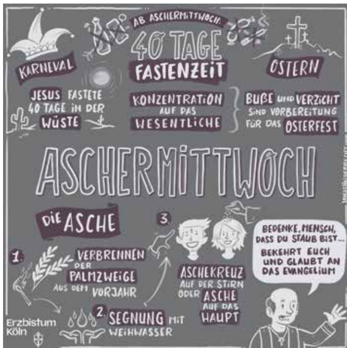
Grafik: Erzbistum Köln / Jonas Heidebrecht (pfarrbriefservice.de)