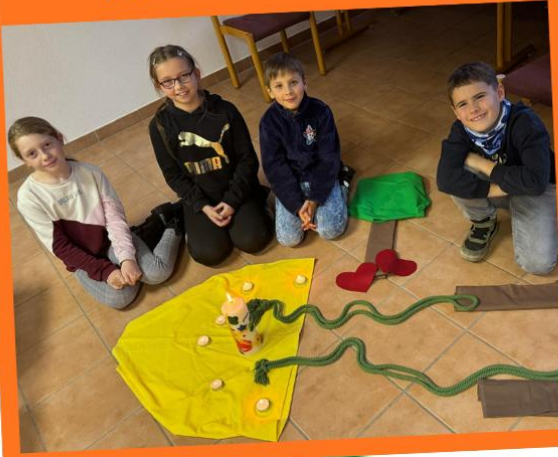
Jesus zu Gast bei Zachäus