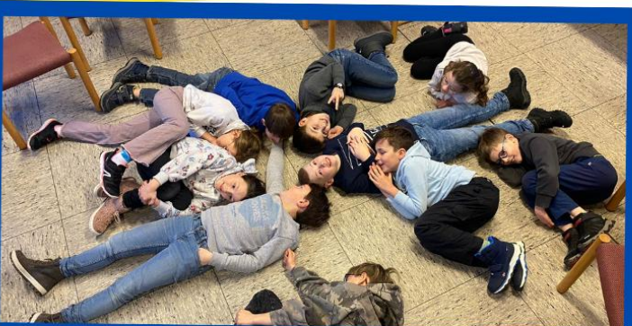
Jesus ist der Weinstock, wir sind die Reben