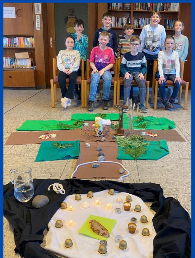
Jesus geht den Kreuzweg - wir gehen mit!

Neben den Katechesen trafen sich die Kinder auch für eine Kirchenführung, eine Tauferneuerungsfeier, ein Wochenende mit der ersten Beichte in der Rhön, einen Film über das Hostienbacken sowie für eine erklärte Messe.