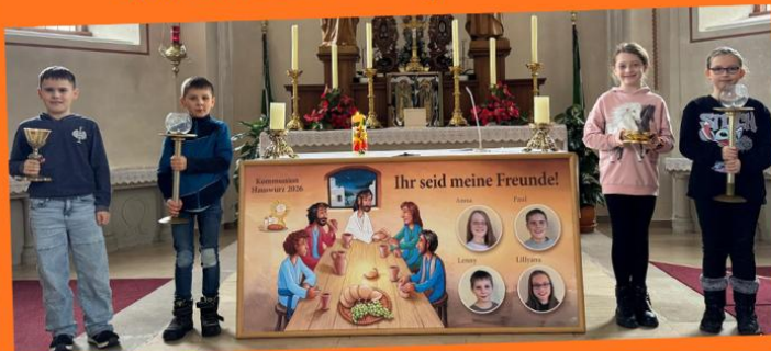
Goldene Schale und goldener Kelch