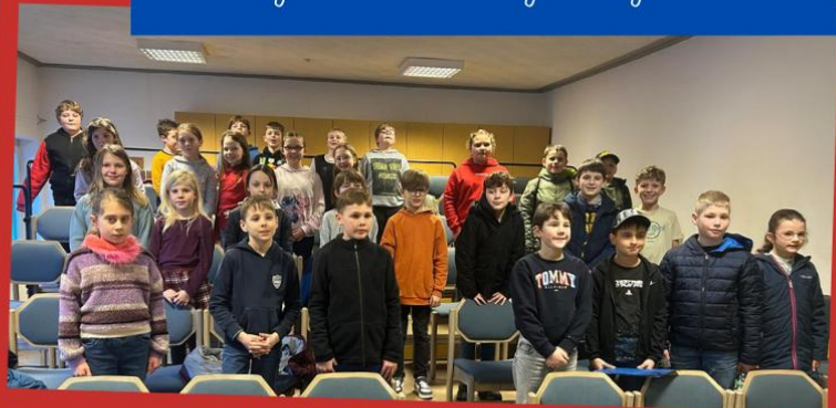
Der Film: "Die Hostienbäckerei"