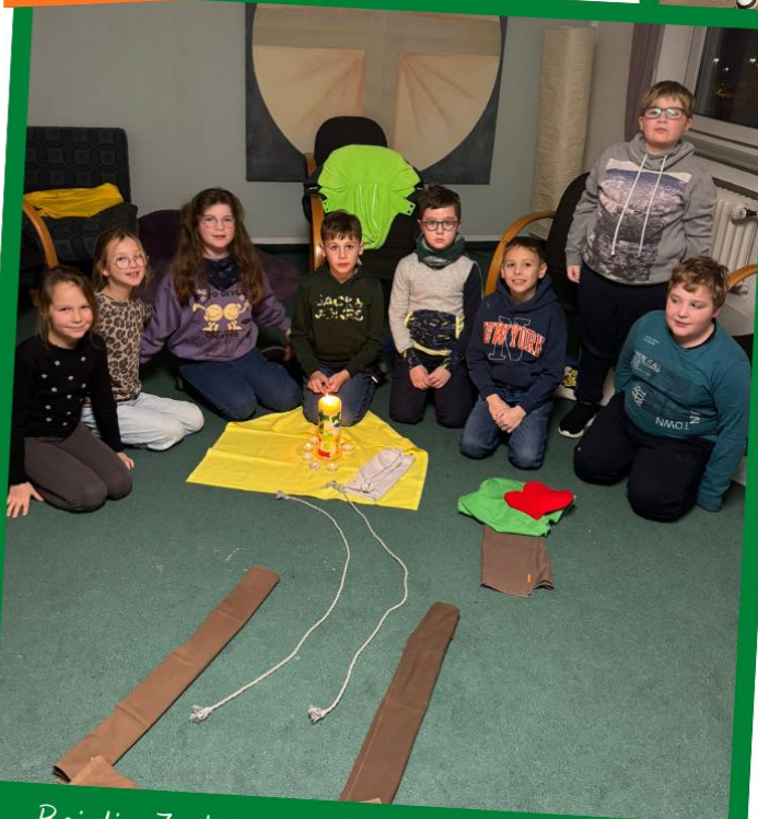
Bei dir, Zachäus, möchte Jesus zu Gast sein!