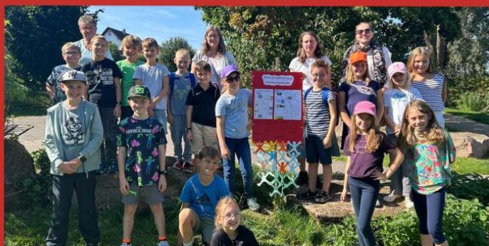
Jesus-Entdecker-Tag in Flieden

Nach einem Eröffnungsgottesdienst am 31.08.2025 in Flieden begann für unsere Kommunionkinder eine spannende Zeit der Vorbereitung auf das Fest der Ersten Heiligen Kommunion. Schon am Beginn der Vorbereitung stand ein besonderer Tag in Flieden auf dem Programm: