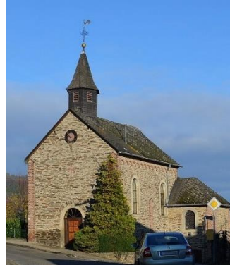
St. Sebastian, Rheinbay