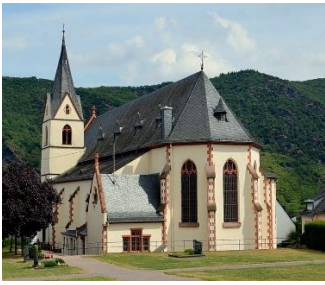
St. Ägidius, Bad Salzig