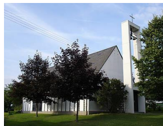
Kapelle in Oppenhausen