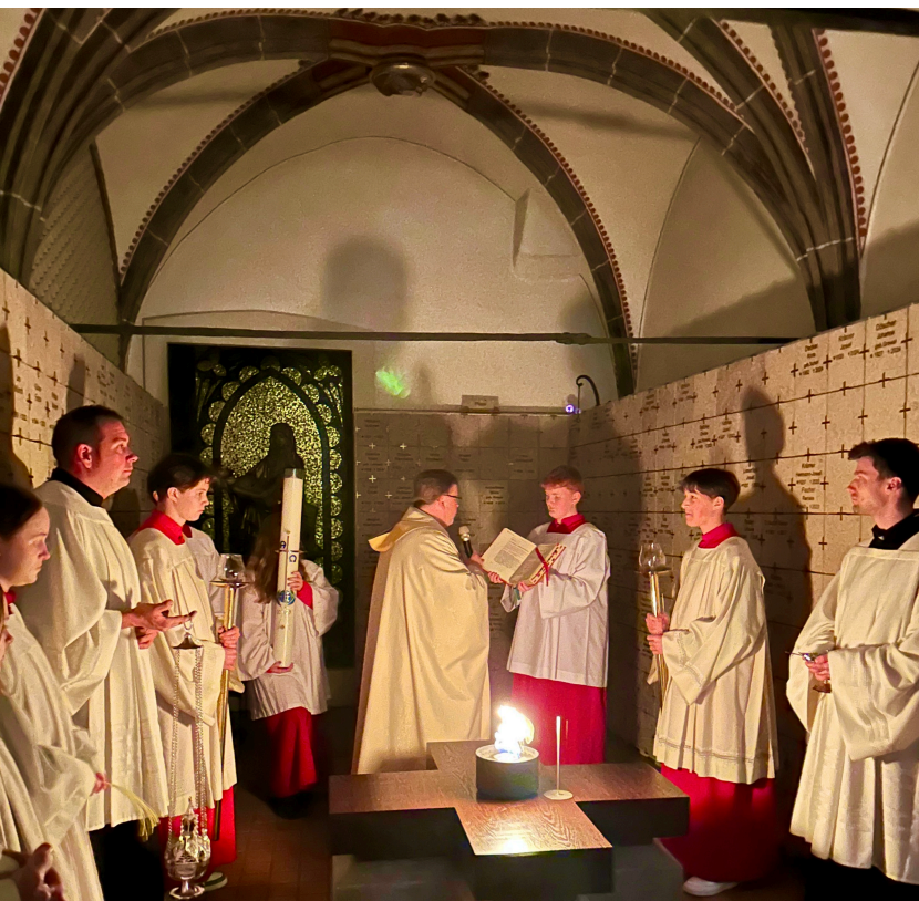
Beginn der Osternachtfeier im Kolumbarium der Karmeliterkirche. Das Osterfeuer wird in der Grabkapelle entzündet. Unsere Toten sind die ersten Zeugen des neuen Lichts, das dann in die Kirche getragen wird. LUMEN CHRISTI - DEO GRATIAS

Warum also schimmert in unseren Gottesdiensten immer auch Hoffnung durch? Vielleicht, weil wir spüren: Wenn wir sie ganz aufgeben, geben wir mehr auf als nur einen Gedanken. Dann verlieren wir etwas von dem, was uns als Menschen trägt.