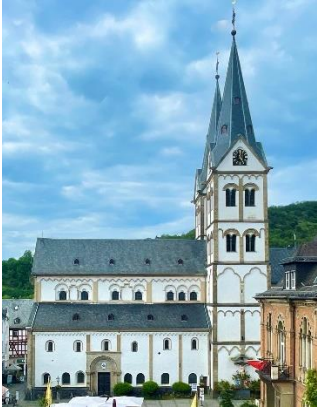
Basilika und Karmeliterkirche, Boppard