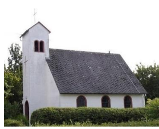
Kapelle in Hübingen