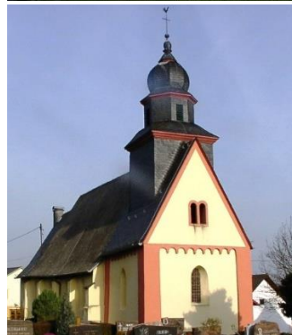
St. Peter in Ketten, Weiler

Samstag, Sonntag und Feiertage, 10:00-18:00 Uhr