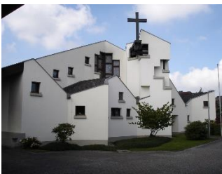
St. Sebastian, Buchholz