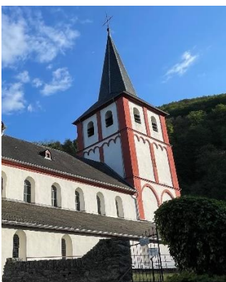
St. Bartholomäus, Hirzenach