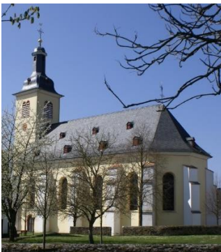
St. Pankratius, Herschwiesen

Samstag, Sonntag und Feiertage, 10:00-18:00 Uhr