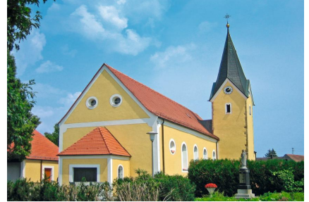
St. Margaretha - Pfelling