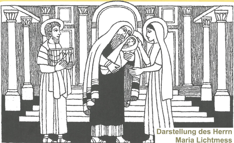
Darstellung des Herrn Maria Lichtmess

2. - 5. So. im Jahreskreis A / Gebet für die Einheit der Christen / Fest der Darstellung des Herrn