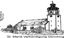
St. Maria Verkündigung Günching