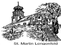
St. Martin Lengenfeld