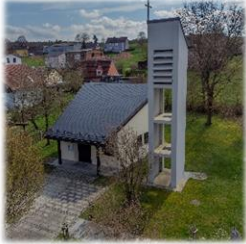
Bruder Konrad Kapelle Hammerles

der Pfarrei Parkstein mit Expositur Kirchendemenreuth