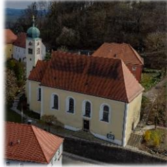
St. Pankratius Parkstein