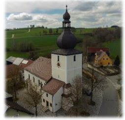
St. Johannes der Täufer Kirchendemenreuth