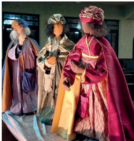
Szene aus der Dreikönigskirche Netstal

Im Neuen Testament werden sie weder als «Heilige» noch als «Könige» bezeichnet. Die in der Westkirche verbreiteten Namen Caspar, Melchior und Balthasar werden erstmals im 6. Jahrhundert erwähnt.