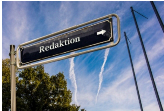
Redaktion