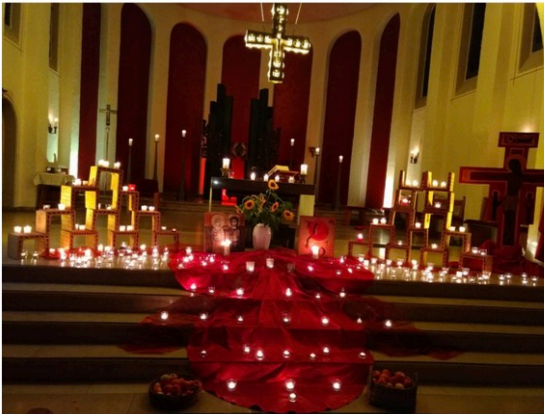
in St. Mariä Heimsuchung, Neuenrade