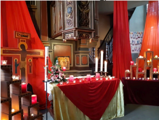
in der Ev. Kirche Neuenrade