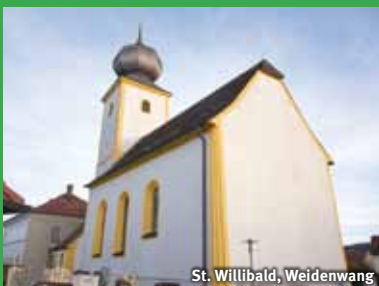
St. Willibald, Weidenwang