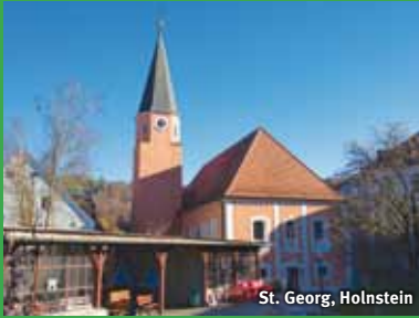
St. Georg, Holnstein