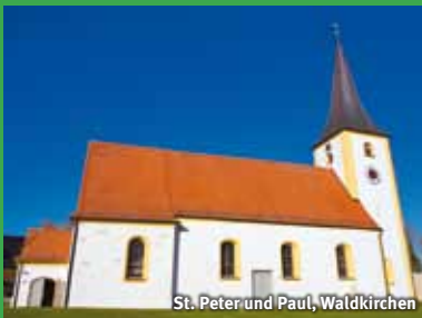
St. Peter und Paul, Waldkirchen