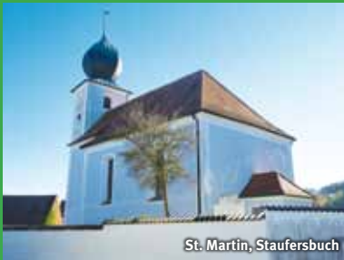
St. Martin, Staufersbuch