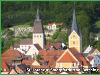
St. Lorenz u. Stadtpfarrkirche, Berching