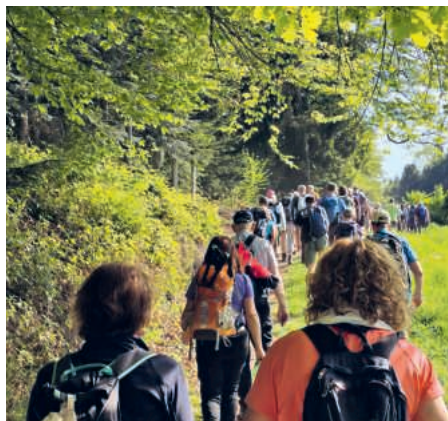
Unterwegs durch Täler und Wälder ...