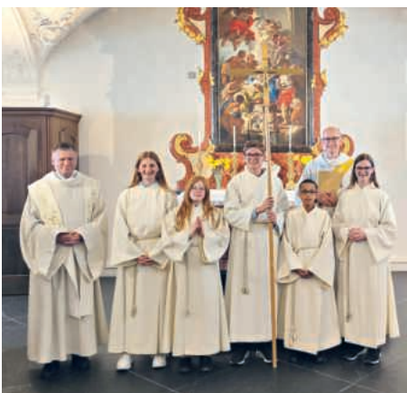
Bereit für den Gottesdienst.