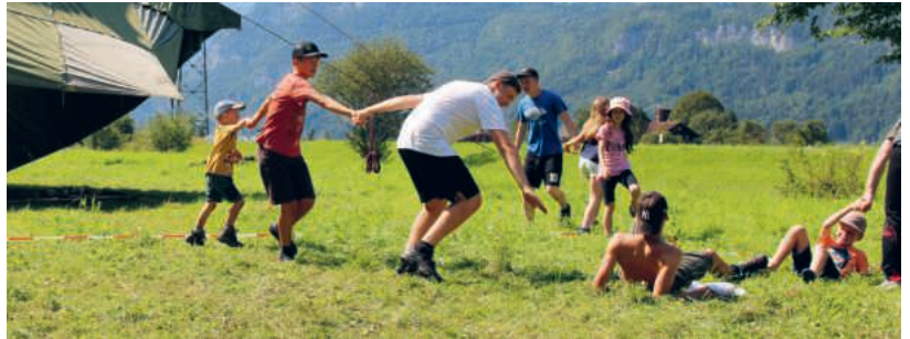
Impression aus einem Geländespiel im Sommerlager.

Unsere Leiterinnen und Leiter stellen ein abwechslungsreiches Programm auf die Beine, bei dem für alle etwas dabei ist, egal ob man gerne herumtobt, kreativ ist oder einfach die Zeit in der Natur