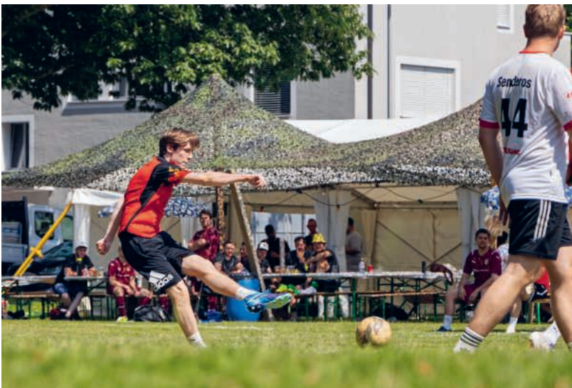
Voller Einsatz am Plauschturnier.