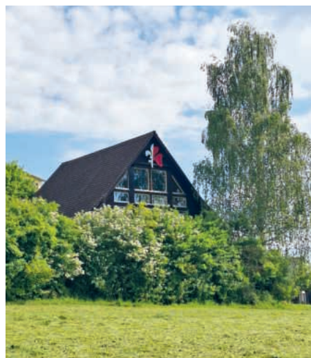
Das Pfadiheim wurde 1986 eröffnet.

das ideale Objekt für ein Pfadiheim. Am 23. April 1985 wurde an der Kirchgemeindeversammlung entschieden, die Pfrundschüür für eine halbe Million