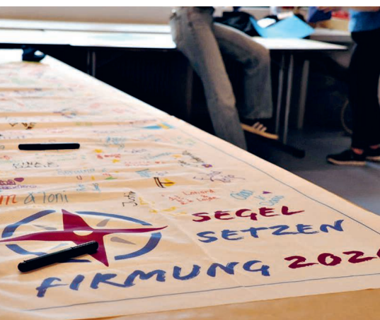
Segel mit den Unterschriften der Firmanden und ihren Paten und Patinnen.