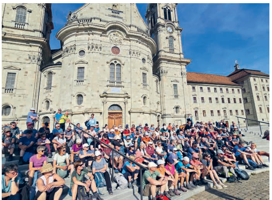
In Einsiedeln angekommen.