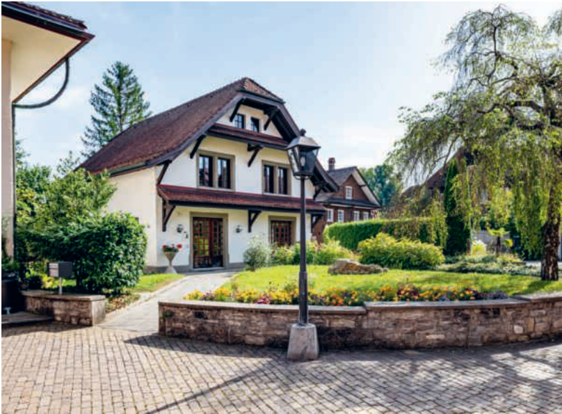
Das Öki wird umgebaut.