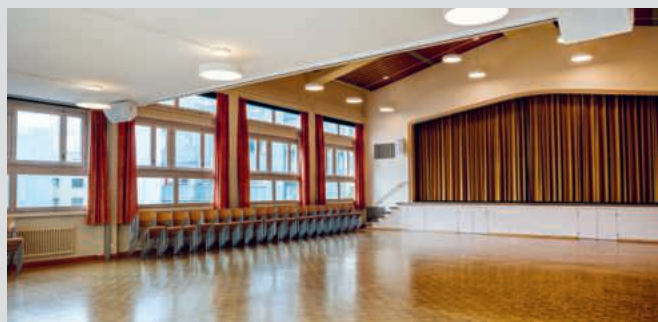
Saal im Pfarreizentrum St. Mauritius.

Sind Sie auf der Suche nach einem Raum für eine Sitzung, ein Fest oder einen anderen Anlass? In unseren Pfarreizentren können diverse Räumlichkeiten gemietet werden. Weitere Informationen gibt's auf unserer Webseite: www.kath.emmen-rothenburg.ch/Raumreservationen