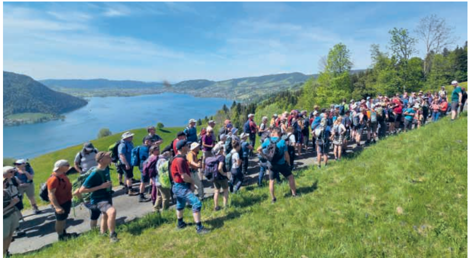
Die Pilgerinnen und Pilger auf dem Weg nach Einsiedeln.