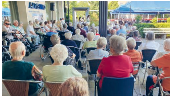
Bei schönem Wetter findet der Gottesdienst beim Betagtenzentrum Alp statt.