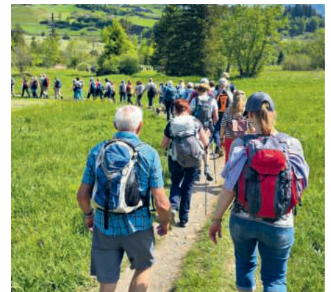
... und durch blühende Wiesen.