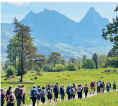
Pilgern vor eindrucksvoller Kulisse.