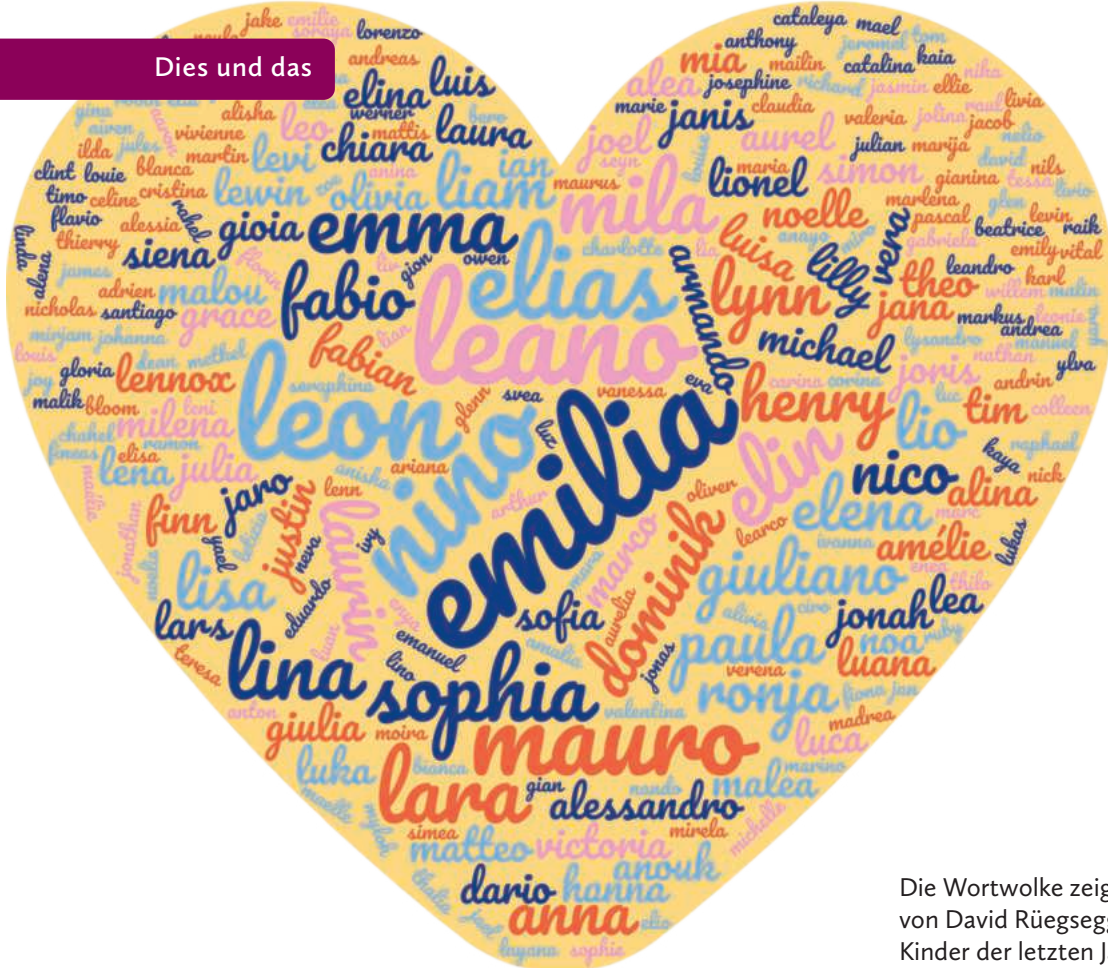
Die Wortwolke zeigt die Namen der von David Rügsegger getauften Kinder der letzten Jahre.