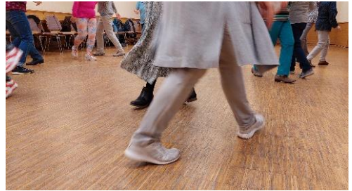
Erinnert ihr euch noch? Meditatives Tanzen am 9. April 2024.