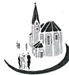
Mariä Himmelfahrt Kirchberg ( KB )

St. Michael Heilinghausen ( HH ) – St. Dionysius Hirschling ( HL ) Schloßkapelle St. Ulrich Karlstein ( KS ) und Spindlhof ( SH )