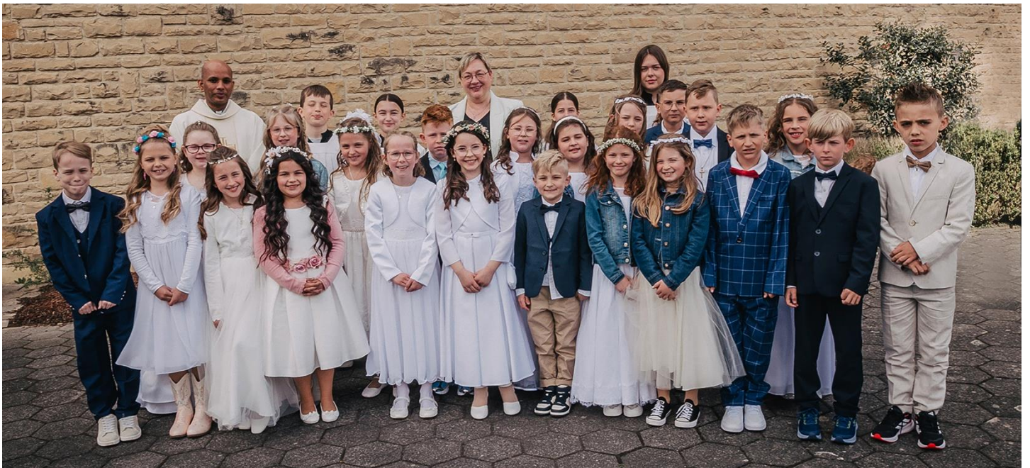
Erstkommunion Irrel