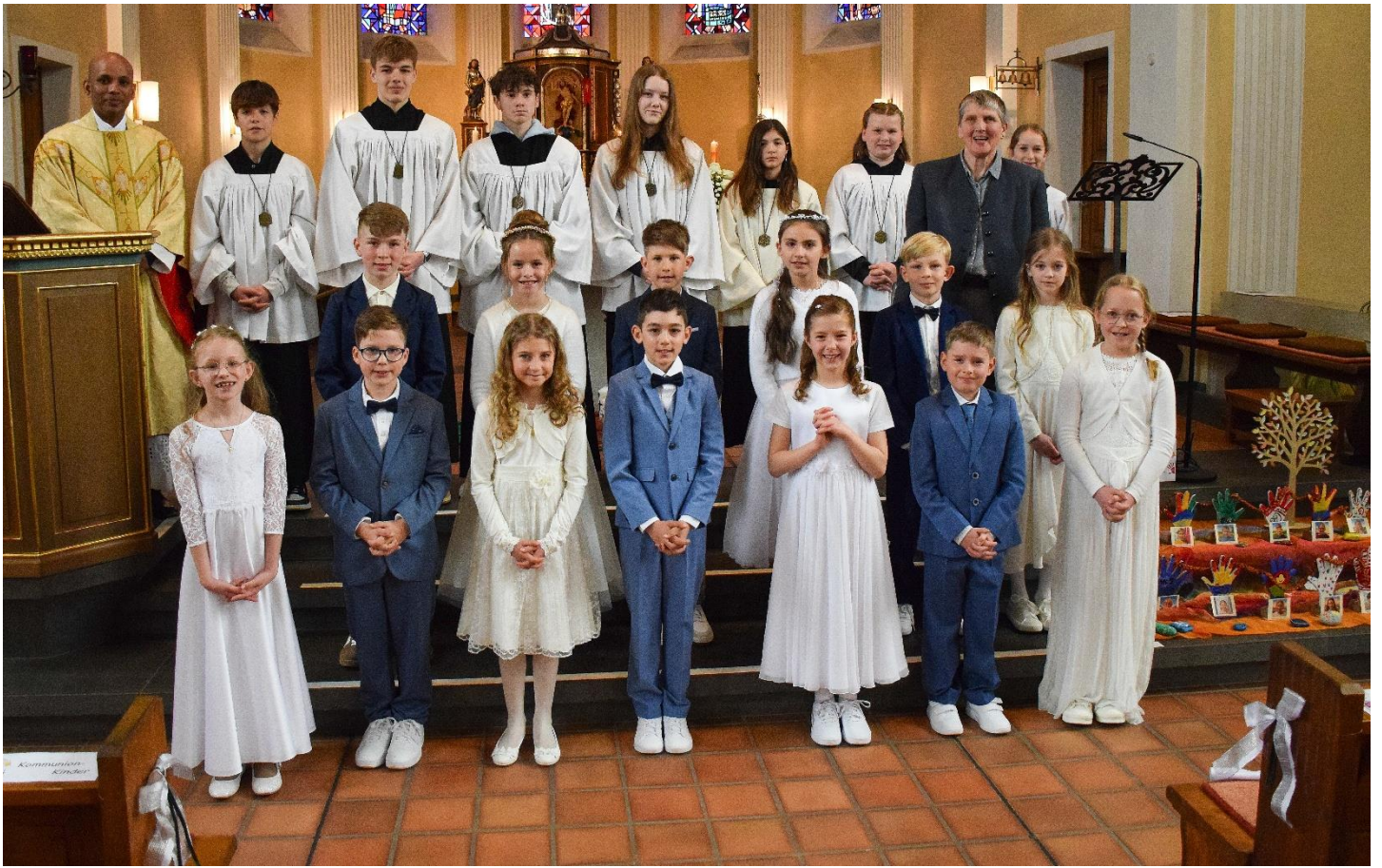
Erstkommunion Wolsfeld