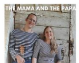
The Mama and the Papa