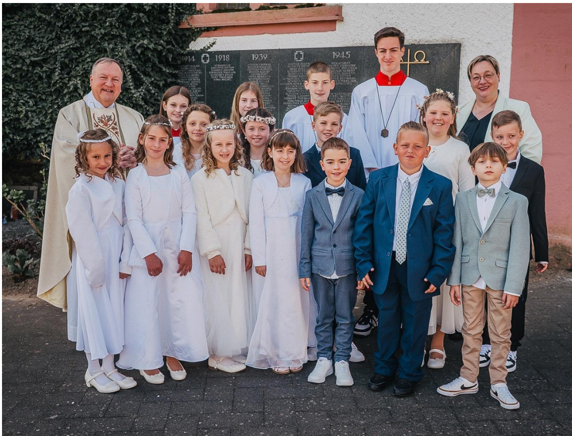
Erstkommunion Ferschweiler