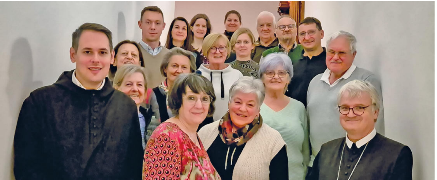
Ein Gruppenfoto des Pfarrgemeinderates von Admont.