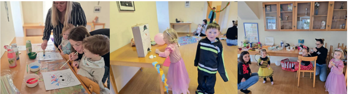
Fasching der Eltern-Kind-Gruppe