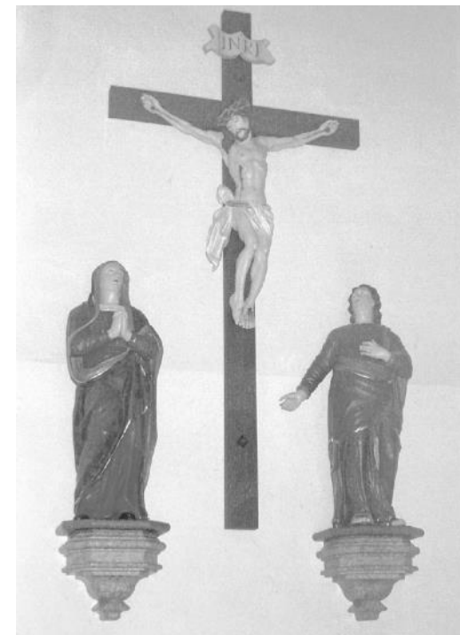
Kreuzigungs-Gruppe in St. Vitus