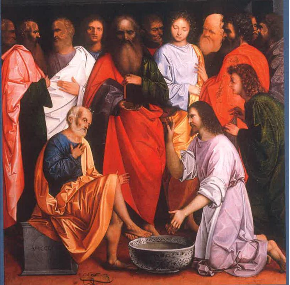
„Die Fußwaschung der Apostel“ um 1500 Öl auf Holz, Vendig, Galleria dell' Accademia aus Gemeinsam Glauben

Pfarrei Konz St. Johann-St. Nikolaus-St. Marien