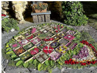
Die beiden Blumen-Mosaik-Bilder anlässlich des Herz-Jesu-Festes in Aulfingen.