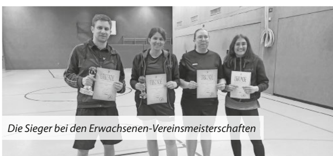
Die Sieger bei den Erwachsenen-Vereinsmeisterschaften