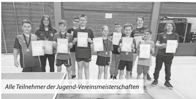
Alle Teilnehmer der Jugend-Vereinsmeisterschaften