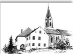
Mariä Himmelfahrt Atting