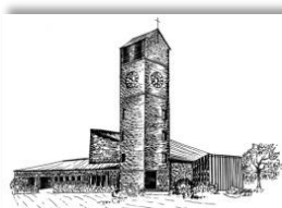
Verklärung Christi Rain

28 Jahre Taizé-Gebet in Rain am Freitag, 30. Januar um 19 Uhr