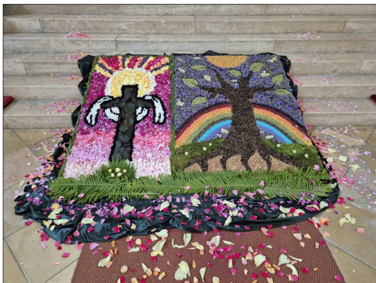
Der Blument Teppich zu Fronleichnam, gestaltet vom Obst- und Gartenbauverein und dem Pfarrgemeinderat.