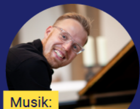
Musik: JENS NIEMANN