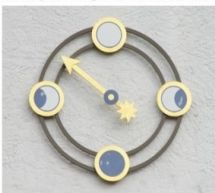
Die Mondphasen-Anzeige am Turm der Liebfrauenkirche.

Hier ist Raum für offene Begegnung, Informationen, Gespräche, Anregungen und Austausch. Dazu gibt es auch kleine Häppchen und Getränke.