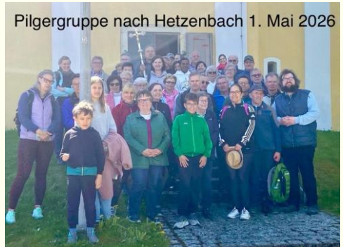
Pilgergruppe nach Hetzenbach 1. Mai 2026